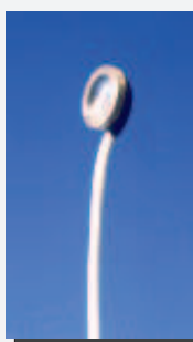
Elettrodo cutaneo sinterizzato Ø6 mm Ref. 39-6 Ø8 mm Ref. 39-8