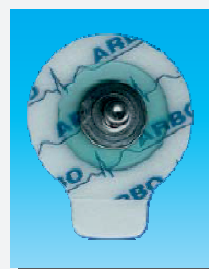
Elettrodo monouso ø24mm. Ref.160-24 ø55mm. Ref.160-55