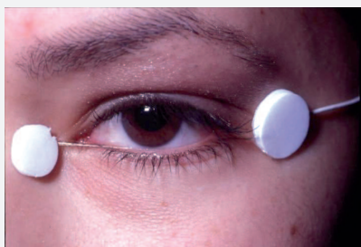
Elettrodo D.T.L. monouso Ref. 54