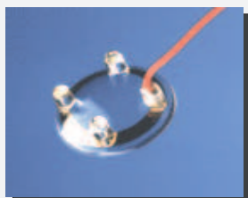
Elettrodo monouso Ref. 38